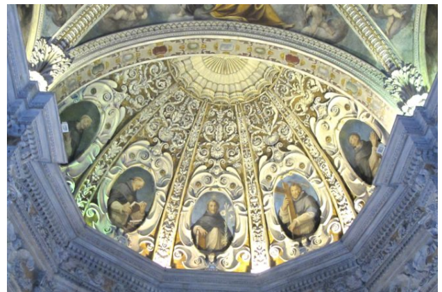
Guglielmo Caccia e aiuti, Catino absidale, Cinque Santi Domenicani