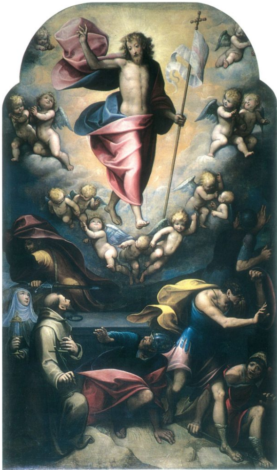
Guglielmo Caccia, Chiesa di S. Giorgio, Abside, Resurrezione di Cristo con San Francesco e Santa Chiara