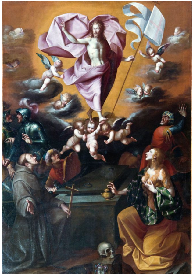
Scuola del Moncalvo, Duomo, Cappella della Resurrezione, Resurrezione di Cristo con i Santi Francesco d'Assisi e Maria Maddalena