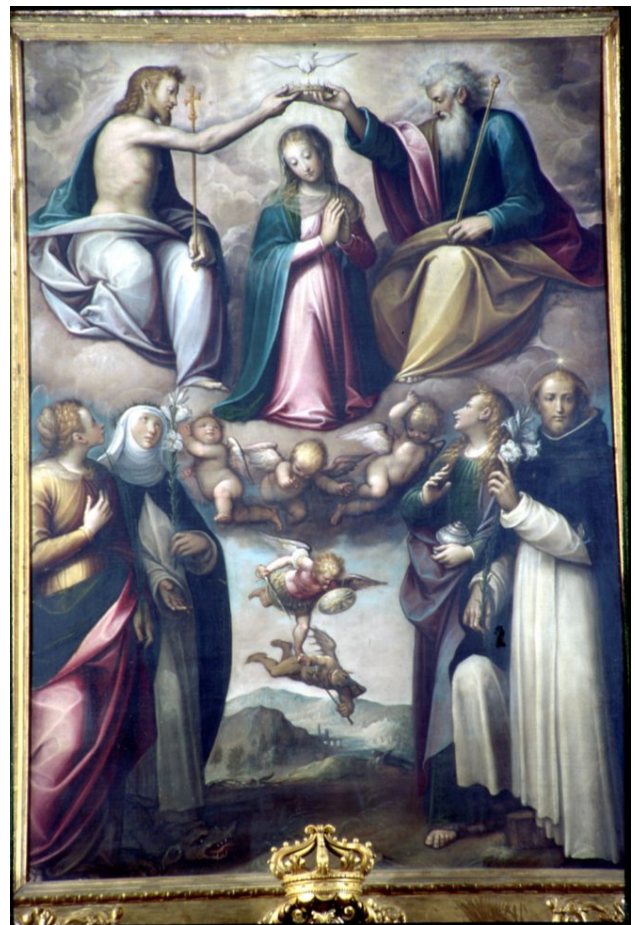
Guglielmo Caccia, Chiesa di S. Margherita, Incoronazione della Vergine tra i santi Domenico, Margherita, Caterina da Siena e Maria Maddalena