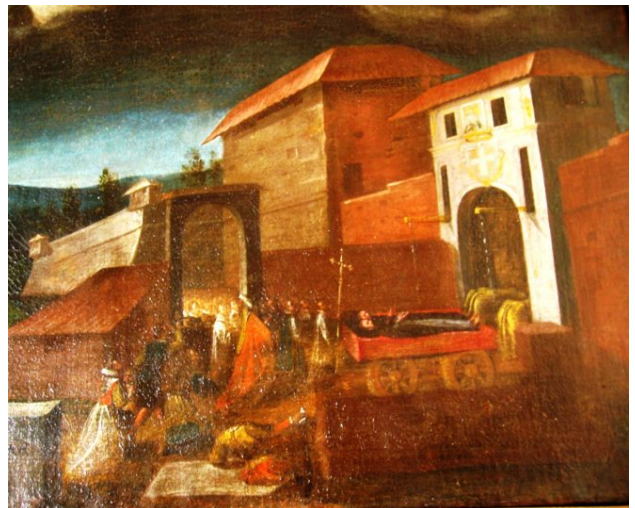
Giovanni Crosio, Municipio, Sala della segreteria, Gloria dei Santi Giuliano e Basilissa, partic. della Porta del Moretto