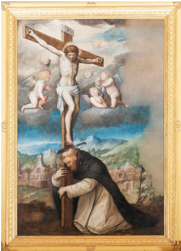
Guglielmo Caccia, Cappella di San Pietro, San Pietro Martire e il Crocifisso