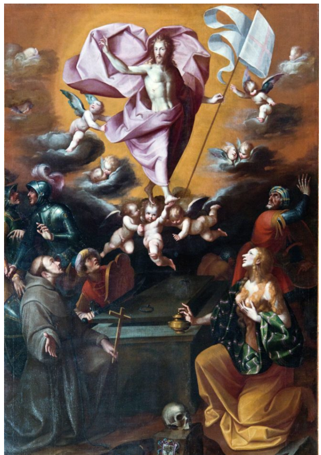
Scuola del Moncalvo, Duomo, Cappella della Resurrezione, Resurrezione di Cristo con i Santi Francesco d'Assisi e Maria Maddalena