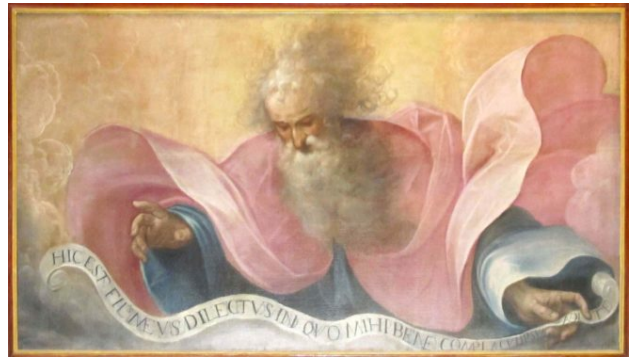
Guglielmo Caccia, Chiesa di S. Giorgio (Casa parrocchiale), Eterno Padre