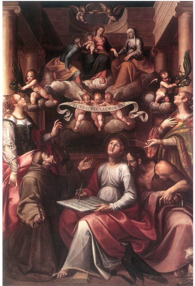
Giovanni Crosio, Chiesa di San Giorgio, Sacra Famiglia con i Santi Giovanni Battista, Giovanni Evangelista, Francesco e due Sante Martiri