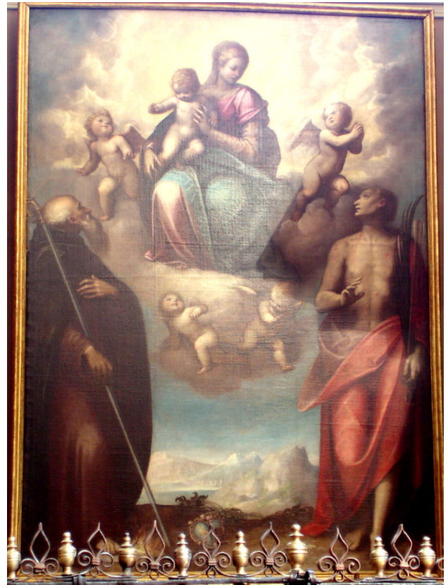
Guglielmo Caccia, Duomo, Cappella dei SS. Antonio Abate e Sebastiano, Madonna con Bambino e i Santi Antonio Abate e Sebastiano