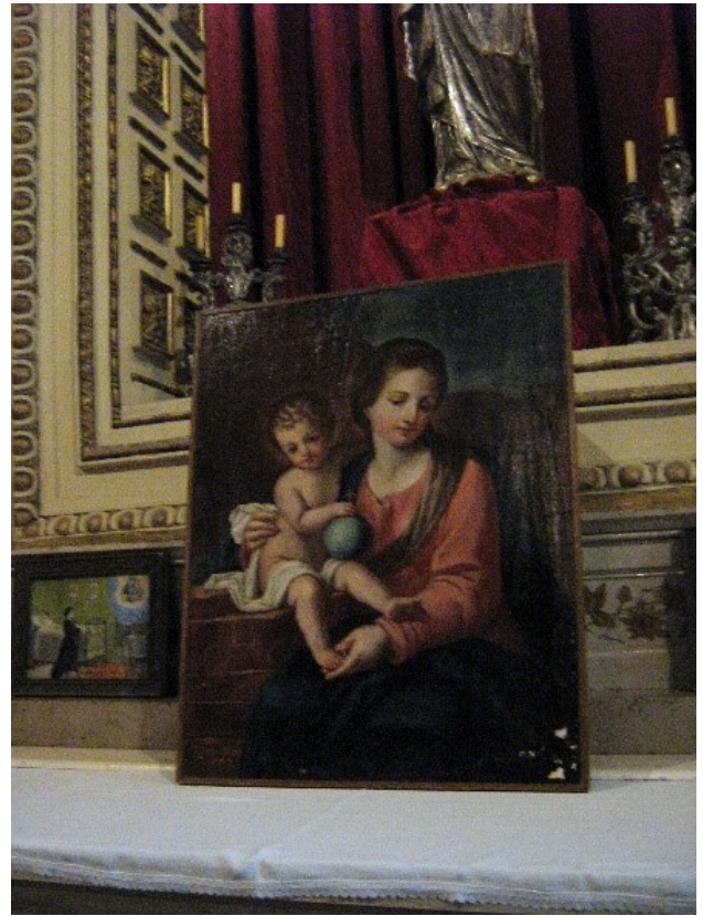
Francesco Fea?, Cappella di Nostra Signora della Scala (conservato nella Casa parrocchiale di San Giorgio), Madonna della Muraglia