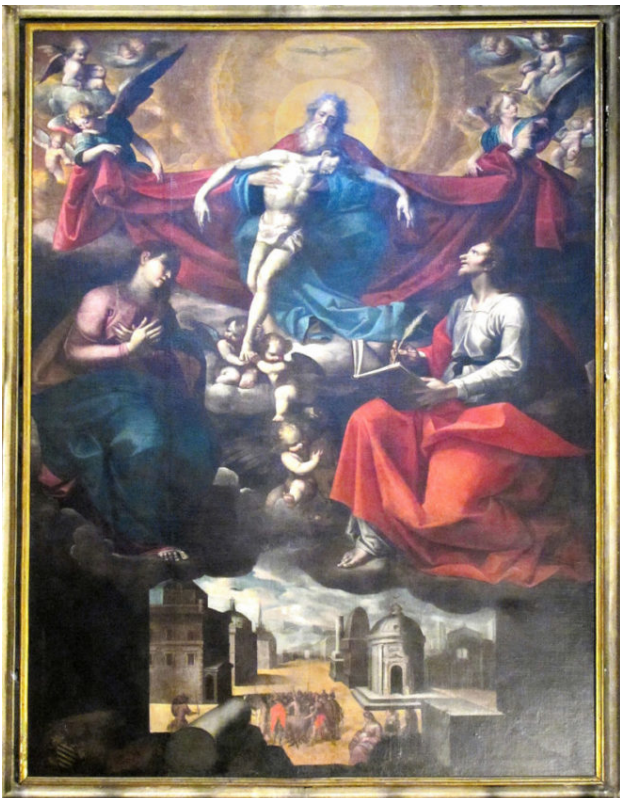
Giovanni Crosio, Duomo, Cappella di San Giovanni Evangelista, La Trinità e San