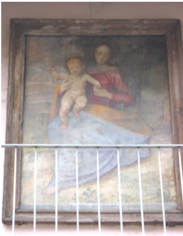
Guglielmo Caccia, Via Tana 22, Madonna con Bambino