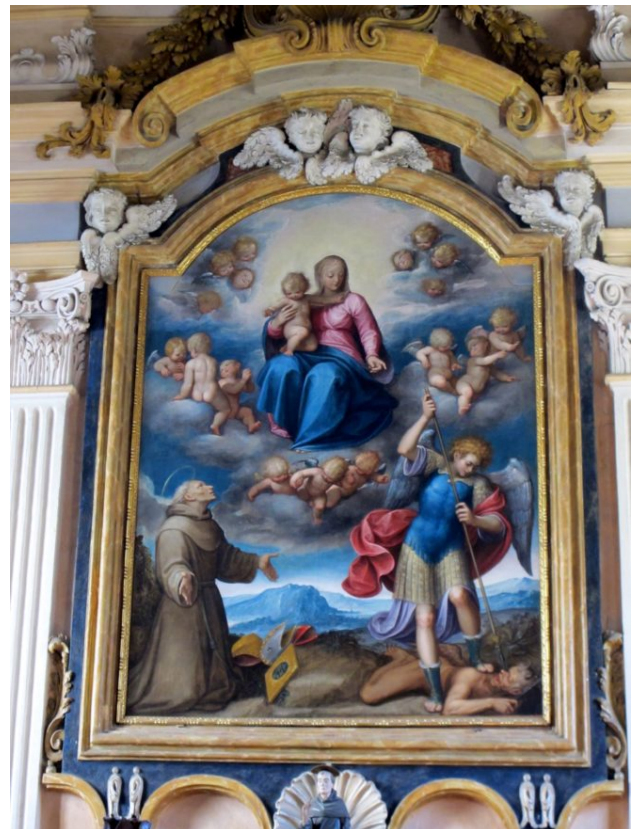
Guglielmo Caccia, Chiesa di S. Bernardino, Coro, Vergine con Bambino e i Santi