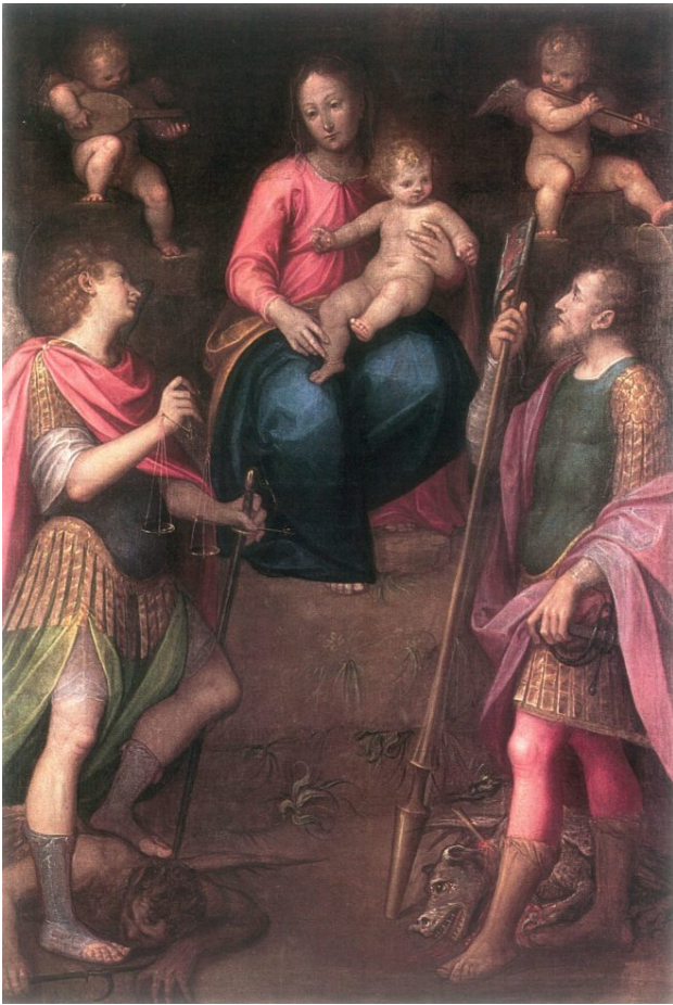
Guglielmo Caccia, Chiesa di S. Michele, Vergine con i Santi Michele Arcangelo e Giorgio