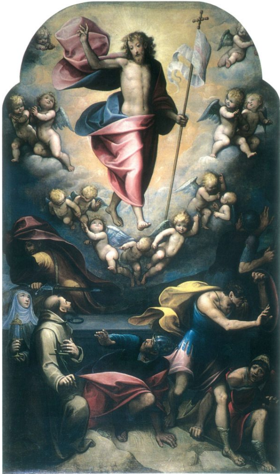
Guglielmo Caccia, Chiesa di S. Giorgio, Abside, Resurrezione di Cristo con San Francesco e Santa Chiara