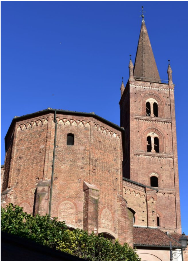
Chiesa di San Domenico a Chieri