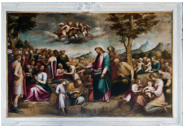
Guglielmo Caccia, Presbiterio, Moltiplicazione dei pani e dei pesci