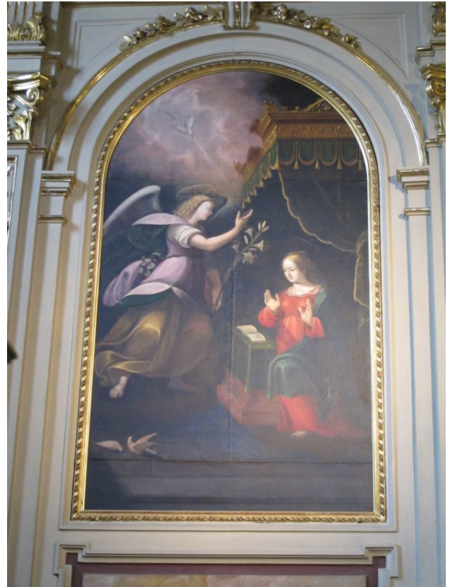
Antonio Cerutti Fea, Chiesa delle Orfanelle, Annunciazione