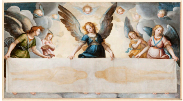
Scuola del Moncalvo, Cappella di Santa Caterina, La Sindone sorretta da Angeli