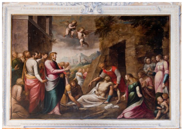
Guglielmo Caccia, Presbiterio, Resurrezione di Lazzaro