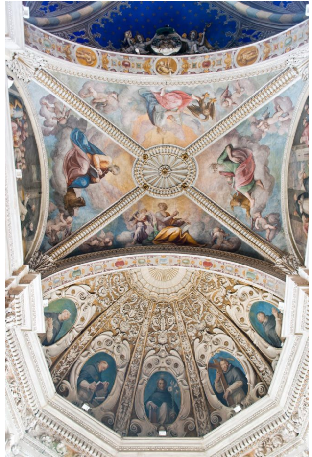
Le volte affrescate dal Moncalvo