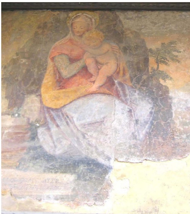
Guglielmo Caccia?, Vicolo Mozzo dell'Annunziata 14, Madonna con Bambino