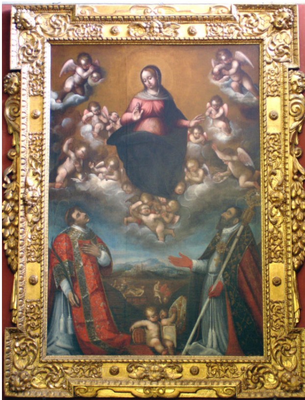
Francesco Fea, Duomo, Cappella della Resurrezione, Assunta con i Santi Lorenzo e Martino