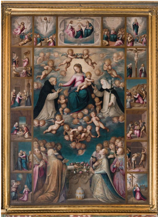
Guglielmo Caccia, Cappella laterale, Madonna del Rosario