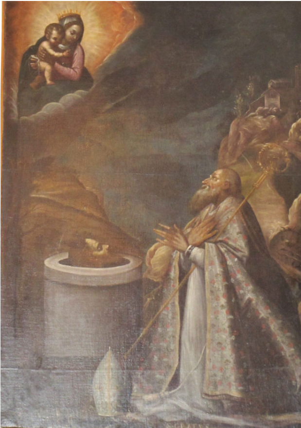
Giovanni Crosio, Chiesa dell'Annunziata, San Grato