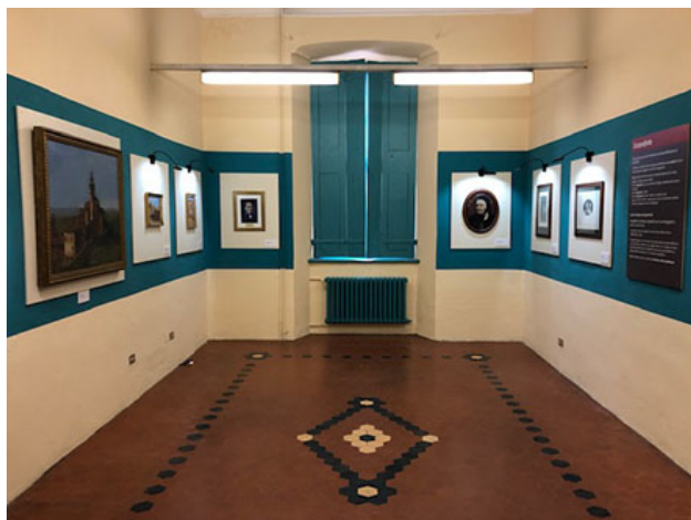
Saletta Maso Gilli, in San Filippo a Chieri

Alle 18 del 18 maggio 2019 viene aperta al pubblico la Saletta Maso Giili, allestita al primo piano nel complesso San Filippo a cura dei volontari della Compagni della Chiocciola, Associazione Avezzana e Carreum Potentia, nell'ambito di un accordo di programma sottoscritto con il Comune di Chieri per la valorizzazione turistica della città e del territorio.