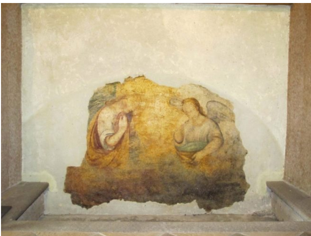
Chiesa di San Giorgio, Cappella del Sacro Cuore, Affresco seicentesco con due angeli

Vedi Bertolotto (2018) e https://www.100torri.it/newsite/wp-content/uploads/2016/12/ANONIMO-Angeli-adoranti-XVII-sec.-due.jpg