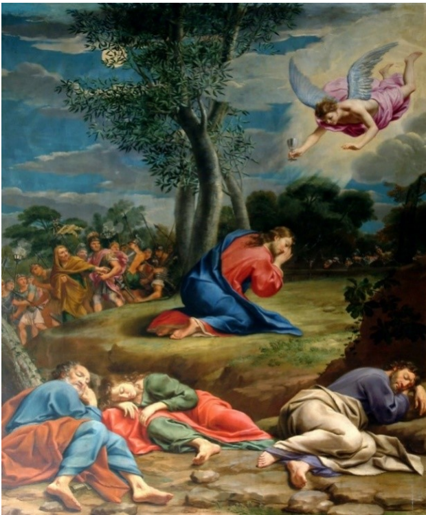
Duomo, Cappella del Crocifisso - Giovanni Francesco Sacchetti, "Agonia di Gesù nell'Orto del Getsemani", 1672 ca

Cristo, al culmine della sofferenza, guarda al cielo nell'atto di invocare il Padre; Maria si accascia svenuta, sorretta dall'apostolo Giovanni; la Maddalena guarda incredula e in lacrime Gesù morente; il soldato sprona via il cavallo, lo sguardo fisso su quell'inquietante condannato. I personaggi sono investiti da violenti fasci di luce, su uno sfondo tragicamente fosco. Le figure sono finemente modellate, in contrasto con la drammaticità della scena".