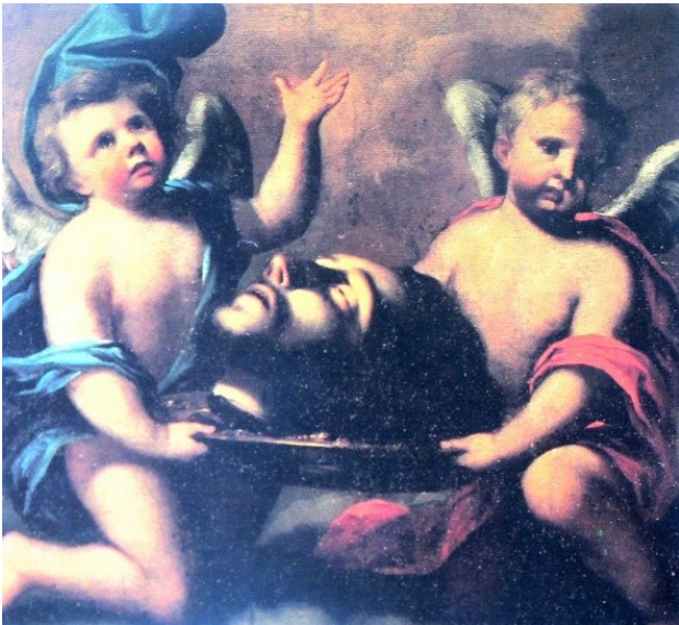
Santuario dell'Annunziata – Lorenzo Dufour, "Il capo del Battista portato dagli angeli", 1669

Per approfondire: Cottino (1999), scheda p. 130 e https://www.100torri.it/newsite/?page_id=24615