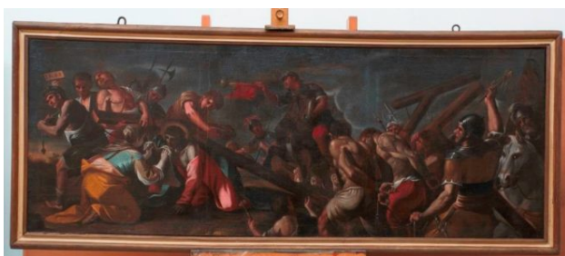
Ospizio di Carità (Casa di Riposo Giovanni XXIII), Mattia Preti (?), "Cristo incontra la Veronica"