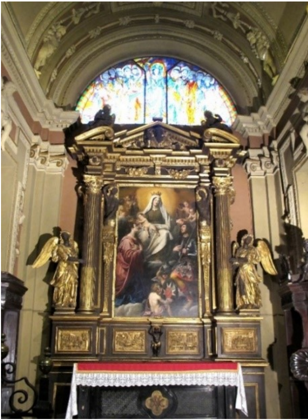
Duomo, Cappella della Madonna del Carmine – Domenico Fiasella (o G.B. Carlone), “Madonna del Carmine e Santi Giuliano e Basilissa”, 1644 ca

Scrive A. MIGNOZZETTI in Artisti nel Duomo di Chieri (2007) :