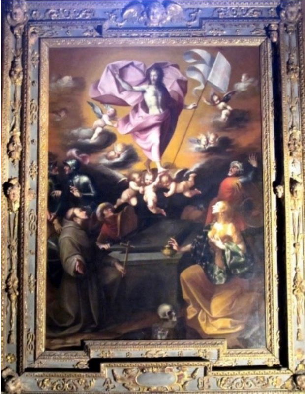
Duomo, Cappella della Risurrezione - Giovanni Crosio, "Risurrezione", ante 1632

Scrive MIGNOZZETTI A., Il Duomo di Chieri (2012), p. 313: