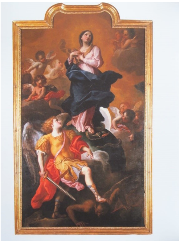
Chiesa di San Filippo - Daniele Seyter, "Immacolata Concezione e San Michele Arcangelo"

Per approfondire: Cottino (1999), scheda p. 130 e https://www.100torri.it/newsite/?page_id=24615