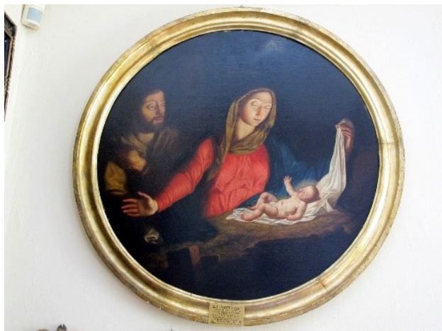
Chiesa di San Bernardino e Rocco, Sala delle consorelle – Joseph Girardi, “Immacolata Concezione e Anime purganti”

Vedi Cottino. (1999), p. 36 e https://www.100torri.it/newsite/?page_id=30068