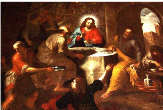
Duomo, Cappella del Corpus Domini - Sebastiano Taricco, "La Cena di Emmaus". 1682 ca.

Realizzata intorno alla metà del Seicento su commissione della Compagnia del Corpus Domini, fu dapprima (1660-1661) interamente affrescata e riccamente stuccata da maestranze luganesi. Pochi anni dopo, sulle pareti dipinte furono collocate 4 grandi tele: due di Sebastiano Taricco (a destra) e due di Antonio Mari (a sinistra).